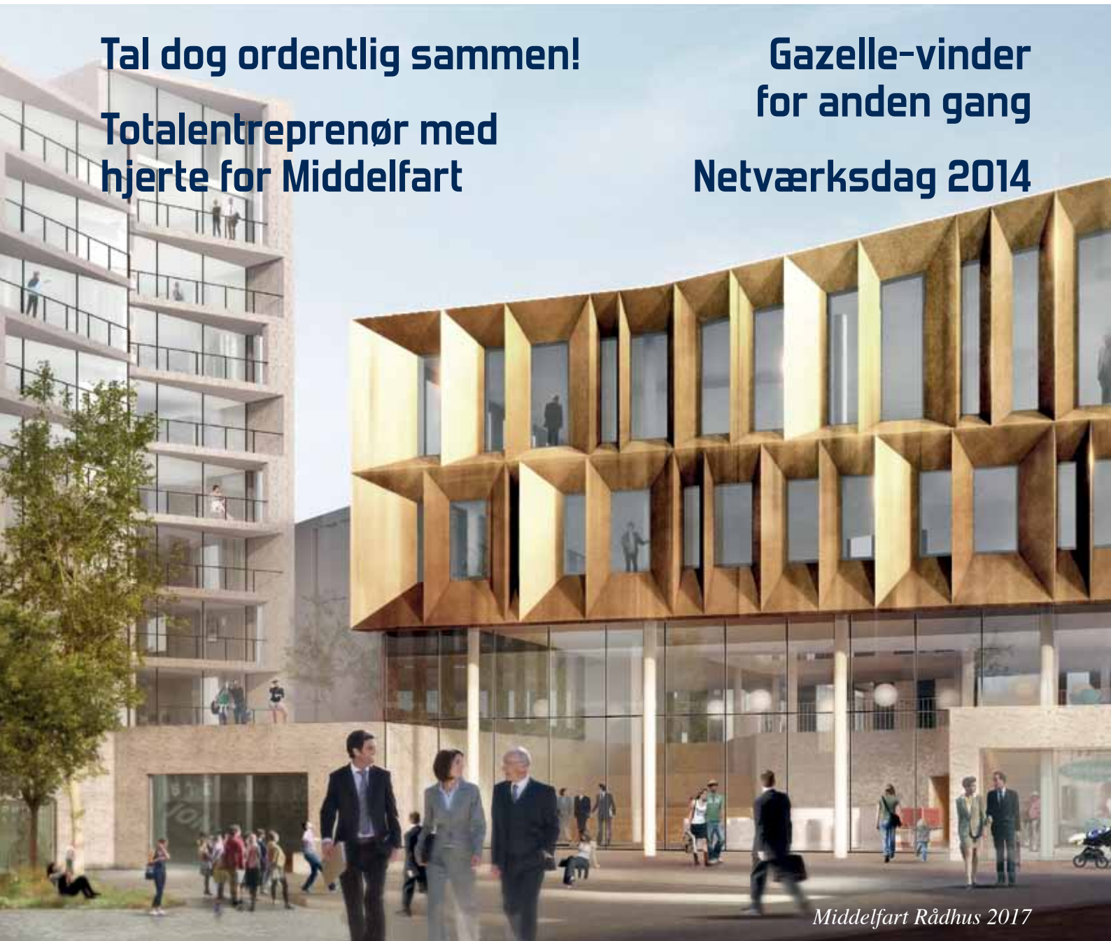
Middelfart Rådhus 2017

Gazelle-vinder for anden gang Netværksdag 2014