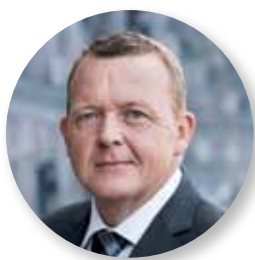
Lars Løkke Rasmussen Formand for Venstre

HVAD GØR DE BEDSTE, NÅR DET HANDLER OM KOMMUNIKATION OG LEDELSE? DELTA PÅ DAGEN OG FÅ DERES SVAR